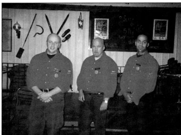
Pracownicy Ochrony dyskoteki „GG” w Uddevalla

Po zakończeniu szkolenia i zaliczeniu i egzaminu z wynikiem pozytywnym, uczestnik otrzymuje certyfikat ukończenia kursu, co pozwala mu na złożenie podania o Licencję Pracownika Ochrony Dyskotek. Wydawana jest ona przez KWP na dwa lata, a terytorialnie jej ważność obejmuje rejon administracyjny komendy, która wydała licencję. Chcąc pracować